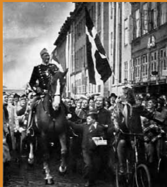
König Christian von Dänemark reitet in schweigendem Protest gegen die deutsche Besatzung durch Kopenhagen (1940)

wurde 1941 von der Wehrmacht besetzt und musste 8 Torpedoboote an die deutsche Reichsmarine abliefern. Vor der Auslieferung wurden aber Geschütze, Torpedowerfer und Navigationsgeräte ausgebaut und versteckt. Die Schiffe waren für die Reichsmarine unbrauchbar. (5) Die dänische Regierung lehnte jede antijüdische Gesetzgebung ab. 1943 wurde die Evakuierung der dänischen Juden nach Schweden organisiert. (6)