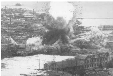
110 Jahre im Geschäft

Eigenen Angaben zufolge produziert das Unternehmen etwa eine Million Zünder pro Jahr, davon 85 Prozent für den Export. 51