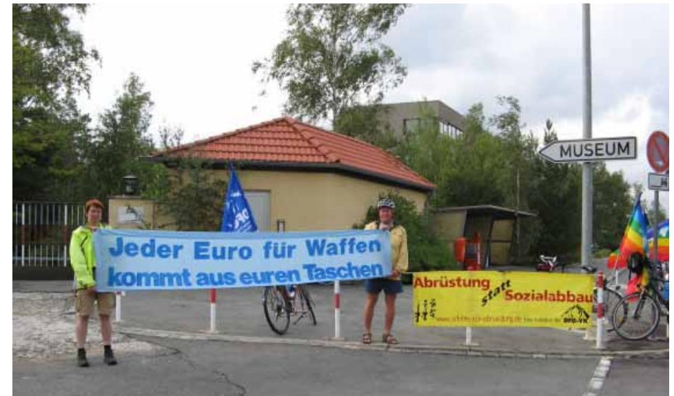
Friedensfahrradtour der DFG-VK Bayern 2007 bei Diehl in Röthenbach