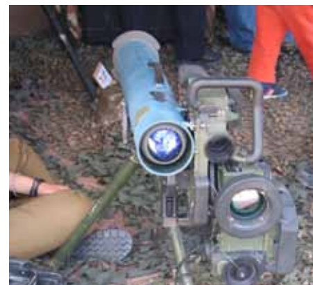
Israeliische Panzerabwehrrakete Spike

Bekannt ist, dass Komponenten aus Diehl-Produktion sich in verschiedenen israelischen Waffensystemen befinden. Beispielhaft seien hier Infrarot-Module der Heidelberger Diehl-Tochter AIM genannt, die etwa im vom israelischen Militär verwendeten Apache-Kampfhubschrauber oder dem Jagdbomber F-16 der Zielerfassung dienen. 82