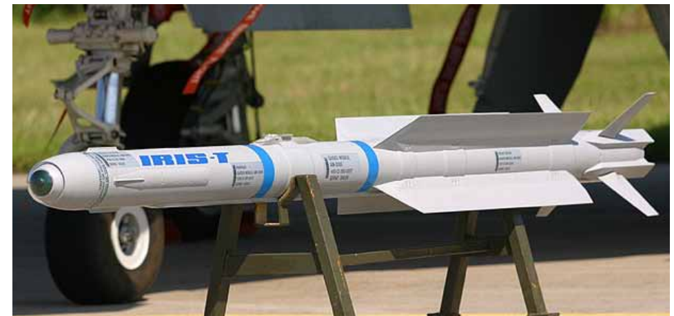
Luft-Luft Lenkflugkörper IRIS-T