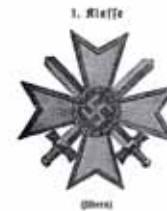
Kriegsverdienstkreuz des NS-Regimes