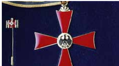
Großes Verdienstkreuz des Verdienstordens der Bundesrepublik Deutschland