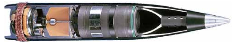
Artilleriegranate 155 mm „Smart“, Schnittzeichnung