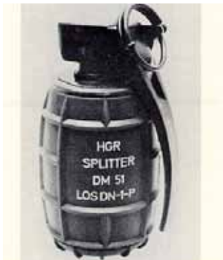
Handgranate DM51/DM51A1 als Splitterhandgranate

Aus der Diehl-Produktion stammt darüber hinaus die Spreng-/Splittergranate DM 51. Sie gehört zur Standardbewaffnung der Bundeswehr und hat einen tödlichen Spliterradius von zehn Metern. 69 Die norwegische Armee ist mit der Diehl-Handgranate DM 61 ausgerüstet. 70