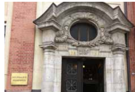
Diehl Stiftung Zentrale in Nürnberg

Mit der eigens dafür gegründeten RTG GmbH beginnt Diehl die Produktion von Raketen, Raketenwerfern und Streubomben. Die Firma produziert u.a. die Bordkanone für die Tornado-Kampffjets. 18