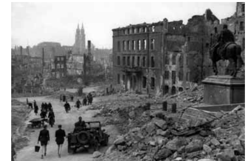
Nürnberg 1945 – jeder hat sein Kreuz zu tragen