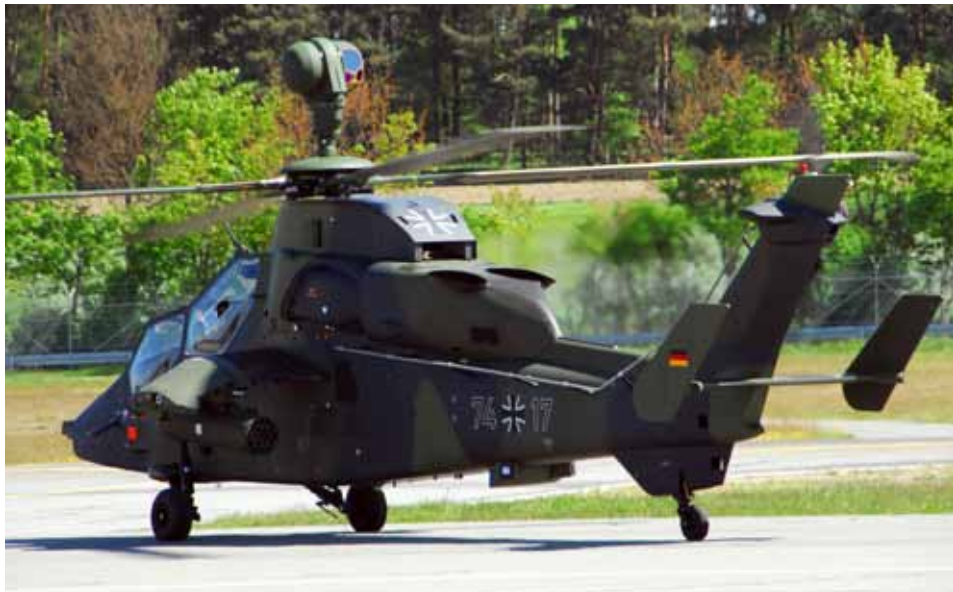
Kampfhubschrauber Tiger der Bundeswehr, Hersteller Fa. Eurocopter / EADS, Cockpit-Ausrüstung und Panzerabwehrrakete von Diehl. Entwicklung seit 1984 – ein Projekt des Kalten Krieges. Statt geplanten 80 werden nur noch 40 Stück von der Bundeswehr gekauft.

Hauptsitz: Diehl Defence Holding GmbH Alte Nußdorfer Straße 13 88662 Überlingen Geschäftsfelder: Rüstung Beschäftigte 2010: 3.097 Umsatz 2010: 726 Millionen